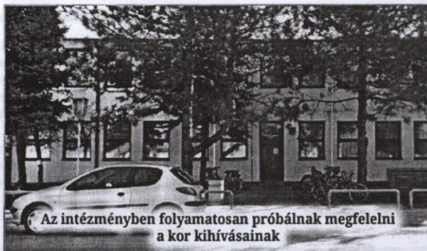
Az intézményben folyamatosan próbálnak megfelelni a kor kihívásainak