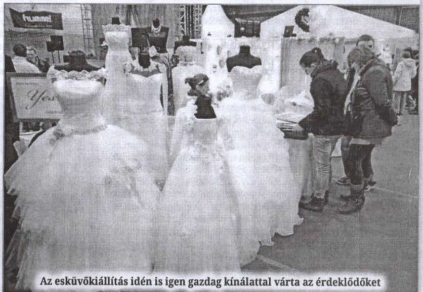
Az esküvői kiállítás idén is igen gazdag kínálatot várta az érdeklődőket