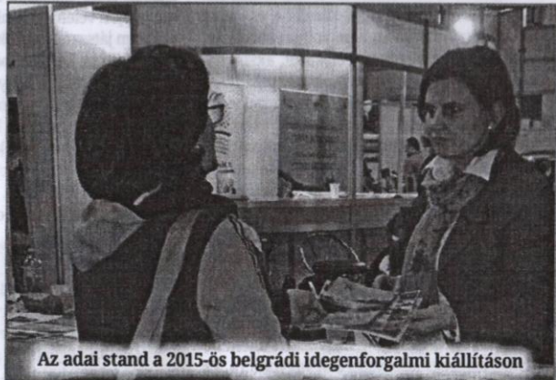
Az adai stand a 2015-ös belgrádi idegenforgalmi kiállításon