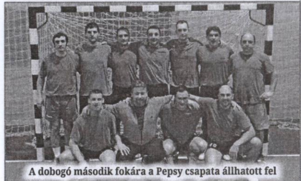
A dobogó második fokára a Pepsi csapata állhatott fel

– Az előző idényhez képest jelentős fejlődést tapasztaltunk a ligában, hiszen egyrészt több csapat nevezett be, mint tavaly, másrészt a csapatok teljesítménye is sokat javult az előző évihez képest. Ugyanúgy a második helyen végeztünk, mint tavaly, ám úgy gondolom, ezúttal sokkal izgalmasabb összecsapásokat kellett megvívniunk ezért a helyezésért, mint az előző idényben. A csapatunk tagjai régóta együtt játszanak, igaz, vannak köztünk olyanok, akik jóval fiatalabbak a többieknél, de alapvetően igen összehozott együttesről van szó, amely sokféle tornán szerepelt más sikeresen, ugyanakkor hétvégenként hobbiszinten is szívesen játszottunk együtt. Úgy vélem, ez a barátság a mérkőzések során is megmutatkozott, különösen azokban a helyzetekben, amikor vesztesre állt a csapat, ugyanis voltak olyan mérkőzéseink, amikor fáradtabbak voltunk, vagy nem játszottunk csúcsformában, de akkor is meg tudtuk mutatni, hogy képesek vagyunk harcolni egymásért, és ennek köszönhetően sok esetben veszett helyzetből vagy jobb csapatok ellen is tudtunk győzni – fogalmazott