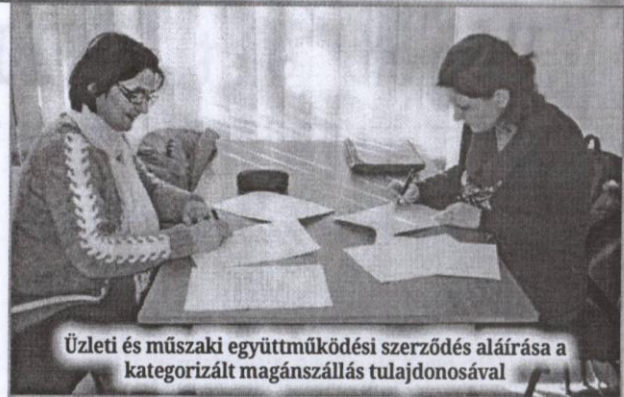
Üzleti és műszaki együttműködési szerződés aláírása a kategorizált magánszállás tulajdonosával

– Az idei évre vonatkozó terveink között szerepel, hogy minél több magánszálláshelyet kategorizálhassunk, ezzel is hozzásegítve a lakosságot a jövedelemkiegészítés lehetőségéhez, valamint szeretnénk kidolgozni a turizmusfejlesztés koncepcióját és programját is. Zenta és Magyarkanizsa községekkel közös elképzelésünk egy kerékpárút kialakítása, illetve kerékpárok vásárlása és bérbeadása az idelátogató vendégek részére. Ezt a tervünket elsősorban különféle pályázati támogatások segítségével tudnánk megvalósítani. A Molprevozsal való együttműködésnek köszönhetően községünk a közeljövőben három idegenvezetővel fog gazdagodni, akiknek segítségét csoportos látogatások esetén bárki igénybe veheti majd. Szeretnénk továbbá kiépíteni egy ún. beachtenispályát is, ugyanis – mint az köztudott – a beachtennis a tenisz egyik legújabb ágaként, amelyet strandröplabda-pályán, speciális ütőkkel és a Play and Stay programból is ismert narancssárga teniszlabdákkal játszanak, mind nagyobb népszerűségnek örvend. Mivel a sportágat külföldön az egyik legdinamikusabban fejlődő sportágként tartják számon, ezért joggal merülhet fel a kérdés, vajon miért ne lehetne nálunk is egy ilyen, miért ne bővíthetnénk ezzel is a kínálatunkat. A pályák kialakításához már megvannak a feltételek, akár a strandon, akár az Adica üdülőközpontban, ám a kellékek megvásárlása még hátravan. Miután ezeknek a feltételeknek is eleget tudtunk tenni, akkor akár egy különleges beachtennistornát is szervezhetünk majd, tovább