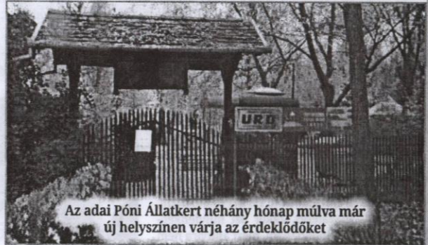
Az adai Póni Állatkert néhány hónap múlva már új helyszínen várja az érdeklődőket