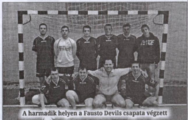
A harmadik helyen a Fausto Devils csapata végzett

– Ada község területén jelenleg több sportklub is igen eredményesen működik, ám az ezek keretében tevékenykedő fiatal sportolók mellett azoknak a személyeknek is szeretnénk volna sportolási lehetőséget nyújtani, akik nem aktívan, csupán kedvtelésből szeretnék ezt művelni. Ezért indítottuk újjára a községi kispályás amatőr labdarúgóligát, amely korosztálytól függetlenül kiváló sportolási és kikapcsolódási lehetőséget kínál azoknak, akik szeretnek focizni, hiszen a kírás értelmében nincs