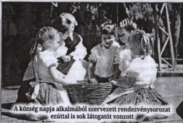
A község napja alkalmából szervezett rendezvénysorozat ezúttal is sok látogatót vonzott

Ada Község Idegenforgalmi Szervezete a tavalyi évben az egyéb aktivitások mellett, mint amilyenek például a sporttal kapcsolatos előkészületek, a csoportos medence- és állatkert-látogatás, a vallási objektumok látogatása, a programtervezés különféle csoportok részére, több sikeres rendezvényt is maga mögött tudhatott.