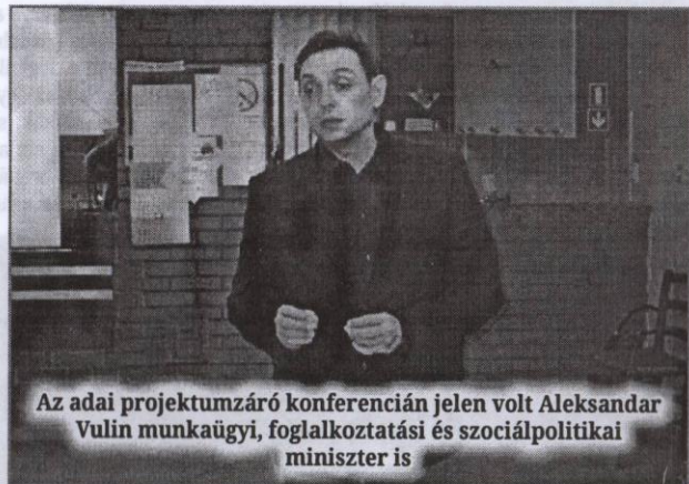
Az adai projektumzáró konferencián jelen volt Aleksandar Vulin munkaügyi, foglalkoztatási és szociálpolitikai miniszter is

A projektumzáró rendezvényen a Duga Civil Szervezet munkatársai ismertették a szociális kártyával és az egyéb, általuk bevezetett módszerekkel kapcsolatos tudnivalókat, valamint beszéltek azok jelentőségéről is. A szegénység nem szégyen, a szégyen az, ha munkával nem küzdünk ellene, szögezte le Vesna Civrić, a szervezet elnöke, aki köszönetet mondott a minisztériumnak, a tartományi titkárságnak, a norvég nagykövetségnek is. A negyvenegyezer euró összértékű projektum ugyanis a norvég nagykövetség támogatásával valósult meg. Nils Ragnar Kamsvåg, Norvégia belgrádi nagykövete kifejtette, a projektum innovatív módja a civil szférá képviselői és az önkormányzatok közötti együttműködésnek, majd hozzátette, ezt a modellt szerinte más községekben is alkalmazni kellene.