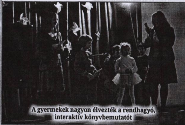
A gyermekek nagyon élvezték a rendhagyó, interaktív könyvbemutatót

A könyv első bemutatójára a Szabadkai Városi Könyvtárban került sor 2014 decemberében, a kötet megjelenését követően, majd a Szabadkai Gyermekszínház adott otthont egy érdekes, matinéserű könyvbemutatónak, aminek ezúttal az adai változatát kísérhette figyelemmel a főként óvodásokból és kisiskolásokból álló közönség.