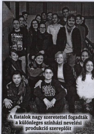
A fiatalok nagy szeretettel fogadták a különleges színházi nevelési produkció szereplőit