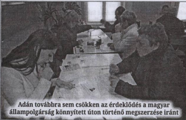
Adán továbbra sem csökken az érdeklődés a magyar állampolgárság könnyített úton történő megszerzése iránt

T izedik alkalommal tartottak kihelyezett konzuli fogadónapot december 11-én Adán, a második helyi közösség épületében, ahol ezúttal több mint kétszázan szerették volna átadni a magyar állampolgárság könnyített úton történő megszerzésére irányuló kérelmüket. Az önkormányzat szervezésében a jövőben a törökfalui helyi közösség épületében ingyenes tájékoztatást nyújtanak majd a magyar állampolgárság könnyített úton történő megszerzésével kapcsolatos tudnivalókról.