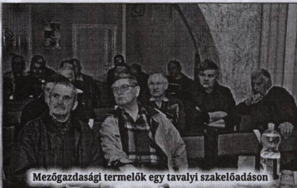
Mezőgazdasági termelők egy tavalyi szakelőadáson