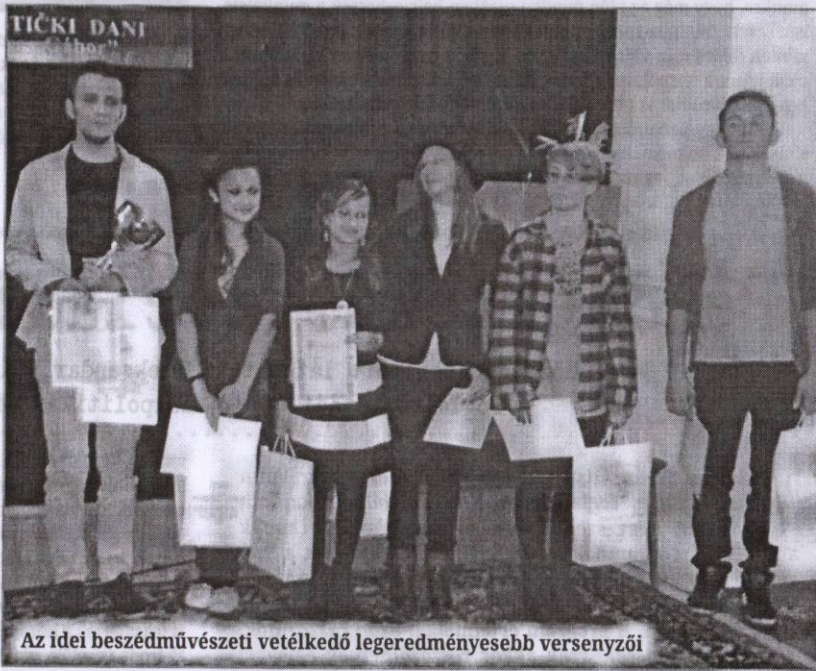
Az idei beszédművészeti vetélkedő legeredményesebb versenyzői