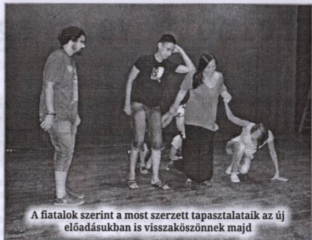
A fiatalok szerint a most szerzett tapasztalataik az új előadásukban is visszaköszönnék majd

– Sokan szokták az önismeretet egy izomhoz hasonlítani, amely, ha nem foglalkozunk vele eleget, nem lesz annyira erős, és ez egy idő után bizony különféle problémákat is okozhat, ugyanúgy, ahogyan a valódi izmok esetében. Aki rendszeresen odafigyel az önismeretre, az megtanulja használni ezt az izmot annak érdekében, hogy egy újfajta szemléletmódot tudjon megvalósítani, akár önmaga, akár a világ irányába. Elég, ha csak a már említett veszteségeinkre gondolunk, amelyek között nyilvánvalóan mindannyiunk életében vannak olyanok, amelyek megakasztják, amelyektől megreked, legyen az akár egy fájdalmas szakítás, akár egy hozzánk közel álló személy