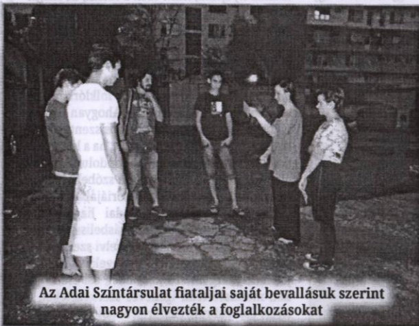
Az Adai Színtársulat fiataljai saját bevallásuk szerint nagyon élvezték a foglalkozásokat