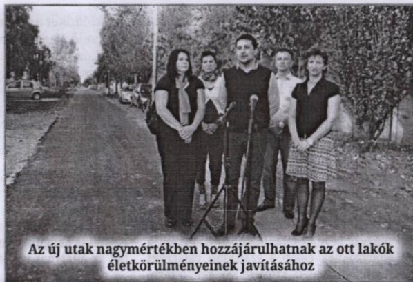
Az új utak nagymértékben hozzájárulhatnak az ott lakók életkörülményeinek javításához