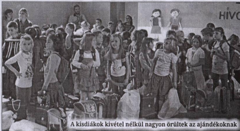
A kisdíások kivétel nélkül nagyon örültek az ajándékoknak